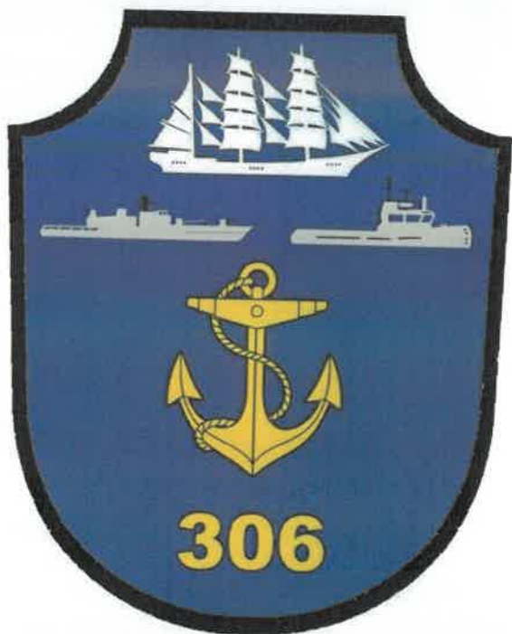
Ecuson brodat pt. mânecă, specific unității, pt. uniforma combat - DNSI