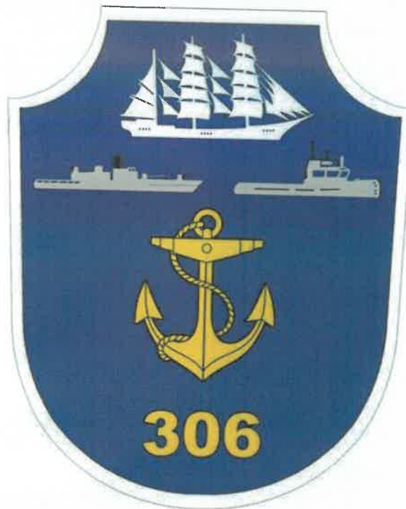
Ecuson brodat pt. mânecă, specific unității, pt. uniforma de oraș - DNSI